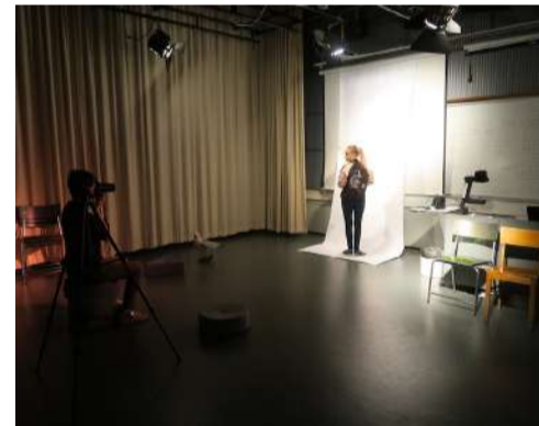
Lempivaatteen kuvaukset Normaalikoululla