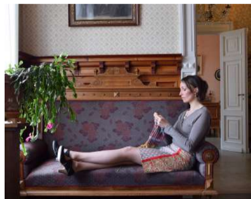
Paikallisväri, teoskuva näyttelyssä.