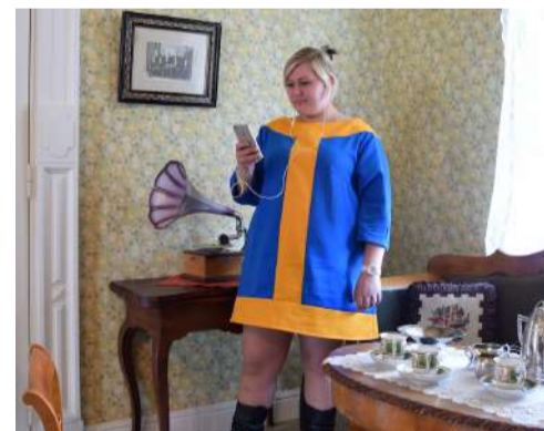
Paikallisväri, teoskuva näyttelyssä.