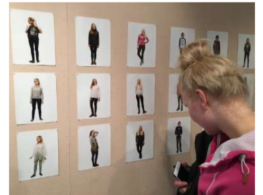
Lempivaate omasta, vanhempien, isovanhempien mielestä.