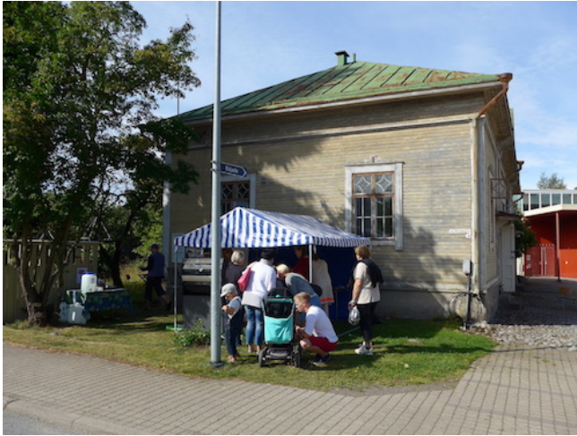
Pop up ravintola