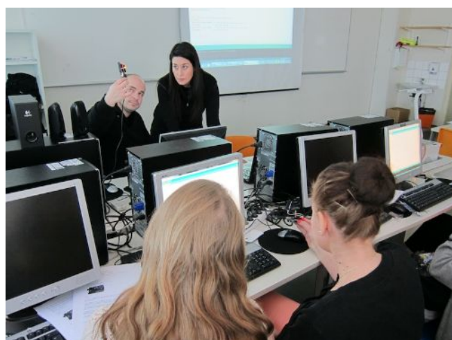
EMO työpajassa oppilaiden kanssa