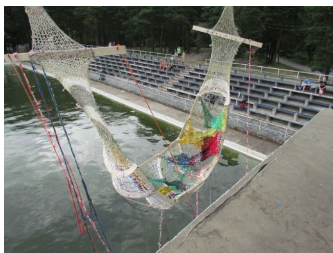
Riippukeinu maauimalassa.