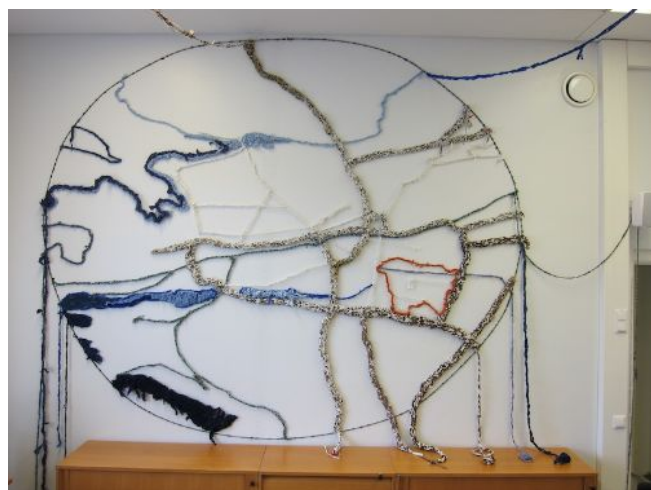
"Rauman kartta", kaupungin matkailutoimisto

Collectif Reversiblellä oli Kauppakeskus Potkurissa pop-up -studio, jossa taiteilijat tapasivat kaupunkilaisia ja kutoivat teoksia kuukauden ajan kolmena päivänä viikossa. Ihmisiä kutsuttiin osallistumaan yhteisötaideteoksen toteuttamiseen tuomalla Potkurin liiketilaan vanhoja kankaita, vaatteita, huonekaluja ja muovipusseja sekä kertomaan kalastukseen liittyviä tarinoita. Kuteiden leikkaamisen jälkeen Collectif Reversible teki suuren \varnothing 3m verkkotaideteoksen, jonka tekemisessä taiteilijat hyödynsivät perinteisiä ammatteja – kalastusta, kutomista ja nypläämistä. Haastatteluista muodostui samalla osa Rauman kaupungin Rauman Tarinaa ja teos Rauman kartta syntyi tarinoista ja paikoista, jotka ovat sekä asukkaille että turisteille merkityksellisiä. Rauman kartta sijoitettiin näyttelyn jälkeen Rauman kaupungin matkailutoimistoon.