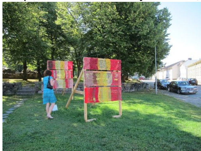
Merimerkit vanhan kirkon raunioilla

Collectif Reversible ( http://collectifreversible.jimdo.com/ )