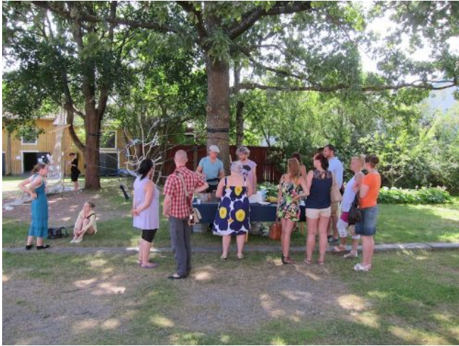
Banketti Rauman taidemuseolla