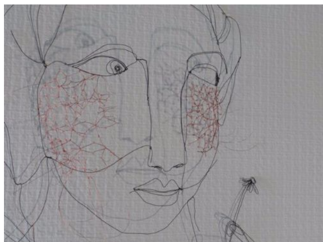
Voikukkanainen 2008, nyplätty metallilanka, yksityiskohta

Pariisin l'Ecole des Arts Décoratifs -korkeakoulussa animaatioelokuvien tekemistä opiskeleva Armel Barraud viettää kesän Raumars taiteilijavierasohjelman residenssitaiteilijana ja on työstänyt näyttelyään raumalaisten nypläystä harrastavien henkilöiden kanssa. Rauman kaupungin kulttuuritoimen kanssa yhteistyössä tuotettu näyttely on esillä Pitsiviikon ajan.