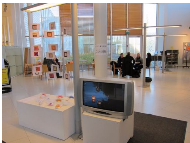
Wish You Were Here Rauman kaupunginkirjastossa