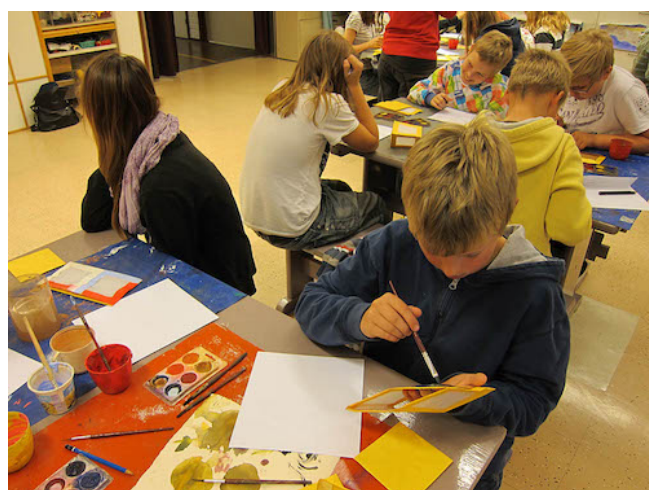
Wish You Were Here -työpaja Rauman freinetkoululla.